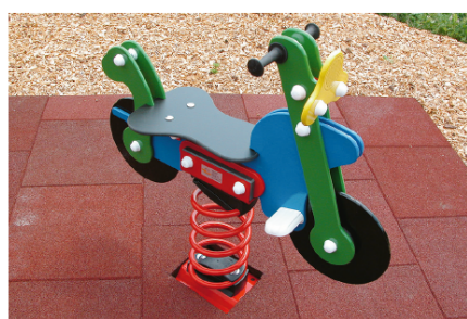
Artikel Nr. N° article